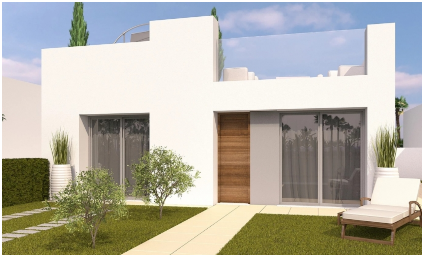
Modern, chick, ansprechend

PARCELA K-3 VILLA MARIA, A-18 Superficie de Parcela: 161,00 m 2